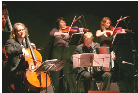
Orquesta Típica Tangarte

El Ayuntamiento de Almería reunió anoche música, cante y baile en el mismo escenario para deleite de los asistentes al teatro Apolo